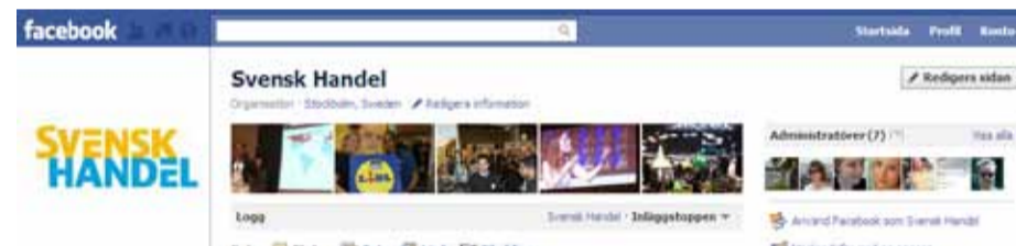
Svensk Handel började synas på Facebook och Twitter.

Under våren syntes Svensk Handel flitigt i medierna med uppgifter om att kronprinsessbröllopet beräknades generera 100 miljoner kronor i intäkter till handeln. Under året släpptes två rapporter och en handbok om e-handel.