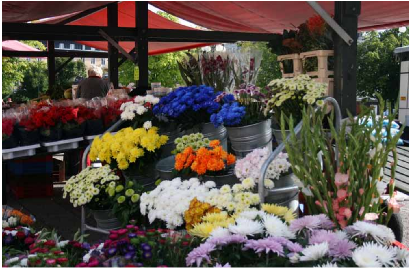
Lika spelregler ska gälla för alla. Torg- och marknadshandeln bör inkluderas i kassaregisterlagen.

Svensk Handel fortsatte driva frågan om torg- och marknadshandeln ska omfattas av kassaregisterlagen. Lika spelregler ska gälla för alla. I arbetet med nya sedlar och mynt lyckades Svensk Handel stoppa ett nytt 20-kronorsmynt som skulle ha inneburit stora omställningskostnader för handeln. I förhandlingen om ett nytt kortavtal valde Svensk Handel att förlänga sitt samarbete med Teller. Svensk Handel medverkade till att etablera ett kassarregisterråd som syftar till att säkerställa branschens moraliska och praktiska arbetssätt.