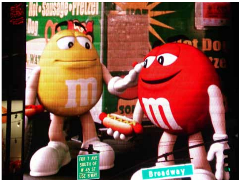
Svensk Handel deltog för fjärde året i rad i FIRAES årsmöte i New York.

vid utvecklingen av infrastrukturella utvecklingsprojekt.